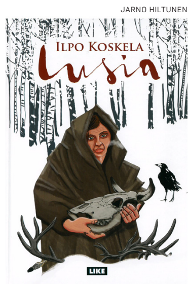
Sarjakuva kertoo kansanelämästä 1600-luvulla Lusia-nimisen naisen kautta.

Musiikkiopistolukukauden jouluisen päätös on Kuhmo-talolla 14. joulukuuta kello 18 ja sinne on vapaa pääsy.